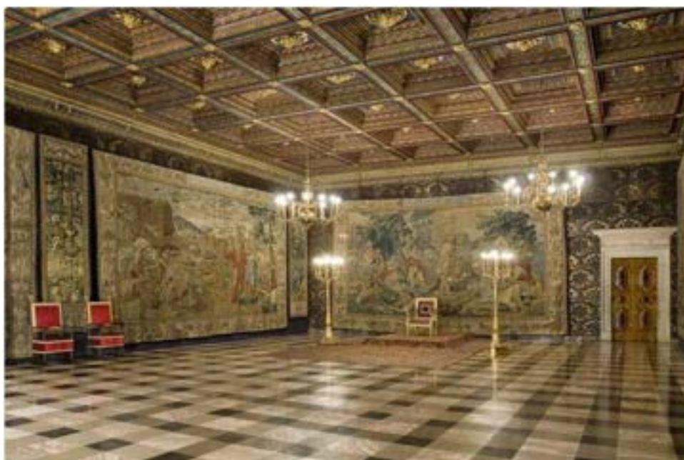
Zamek Królewski na Wawelu